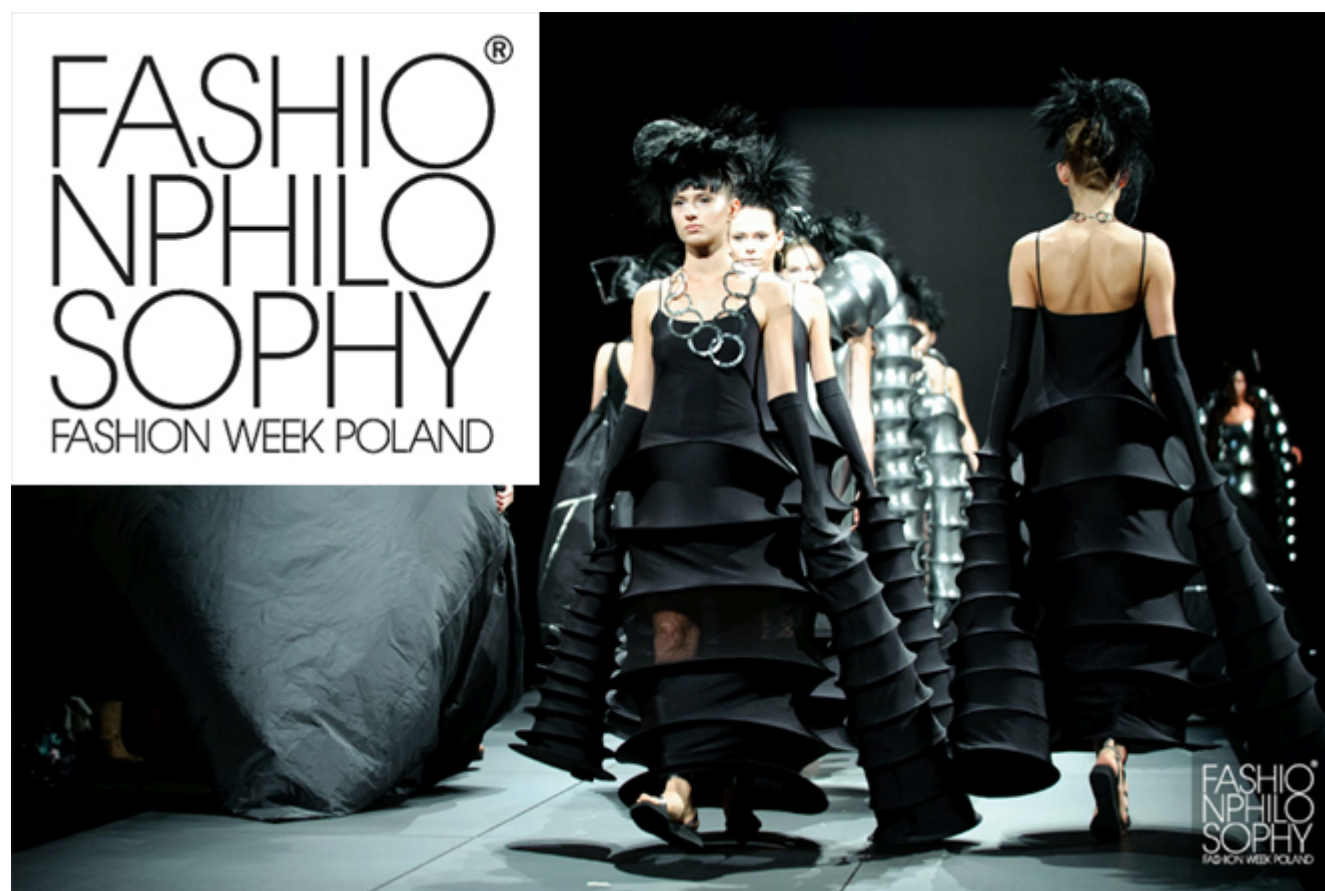
10. edycja Fashion Philosophy Fashion Week Poland

Najważniejsze międzynarodowe wydarzenie modowego w Polsce, czyli jubileuszowa 10. edycja FashionPhilosophy Fashion Week Poland trwa w dniach 6-10 maja. W tym czasie prezentowane są kolekcje na sezon jesień-zima 2014/2015. Jesteście ciekawi przebiegu tego wydarzenia?