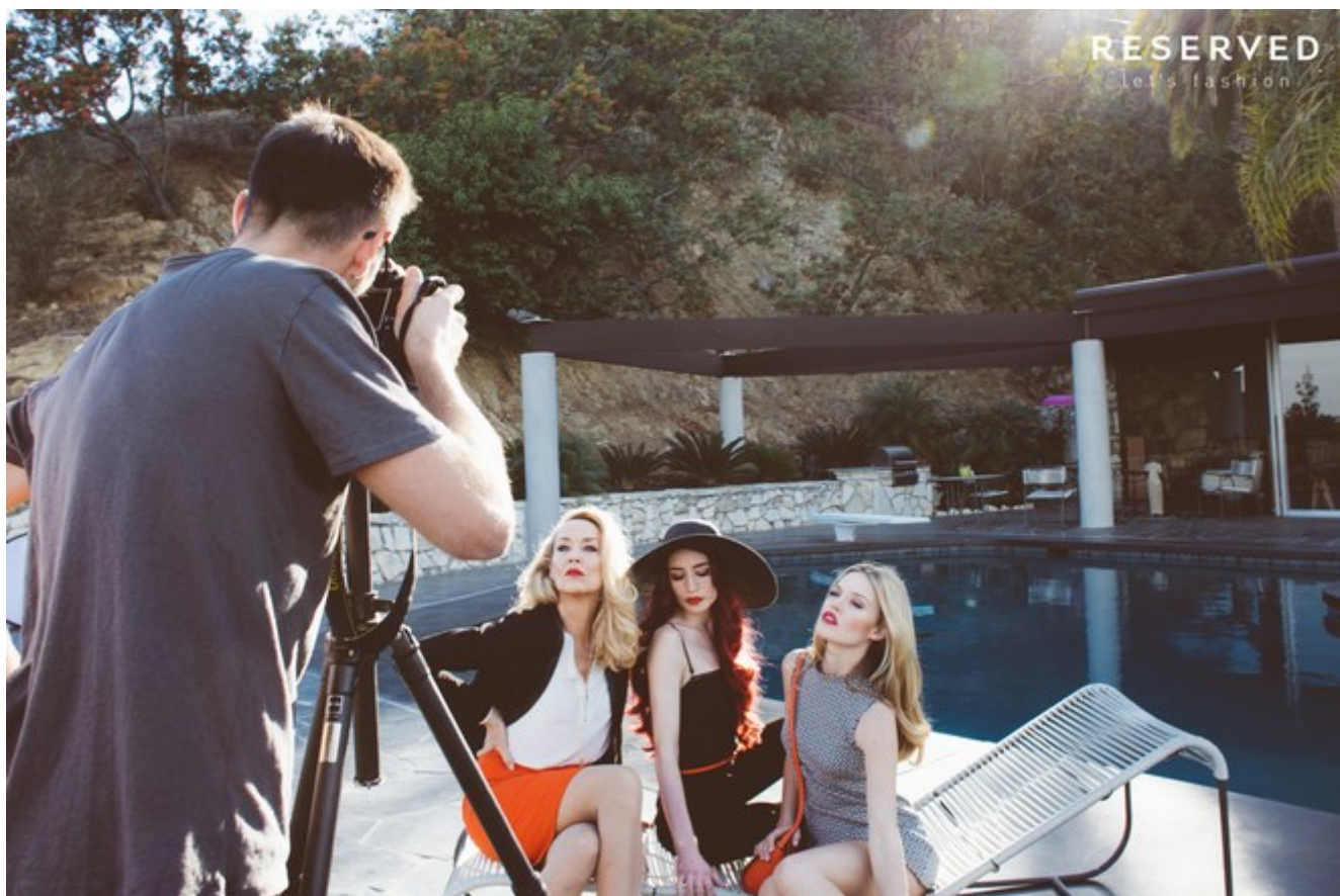
Georgia i Lizzy Jagger oraz Jerry Hall w kampanii Reserved

Jesteście ciekawi kto wystąpi w wiosennej kampanii marki Reserved? Tym razem do Georgii May dołączyły jej siostra, Lizzy Jagger i matka Jerry Hall.