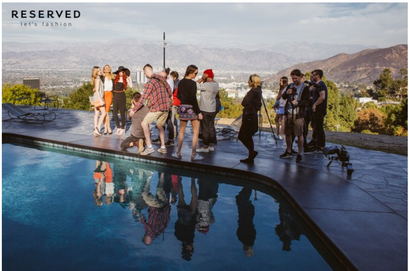
Georgia i Lizzy Jagger oraz Jerry Hall w kampanii Reserved