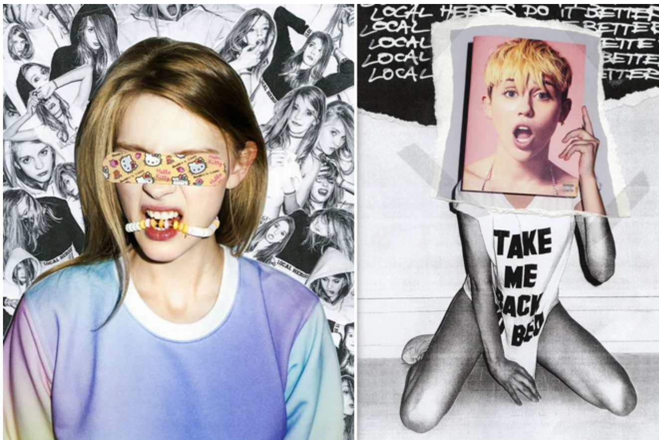
Szalona kampania Local Heroes lato 2014

Najnowsza kampania Local Heroes na sezon letni zaskakuje swoją nietypowością. Nie mamy do czynienia z klasyczną sesją zdjęciową, a z kolażami absolutnie oddającymi stylistykę marki.