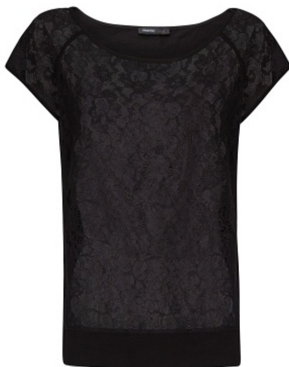
Koszulka - Mango 79 zł