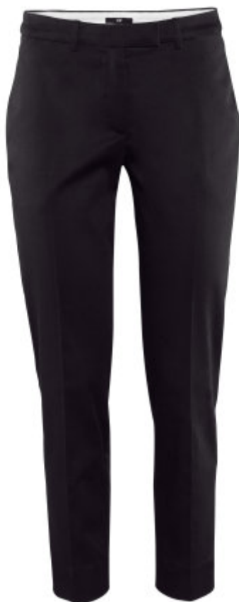
Spodnie - H&M 79,90 zł