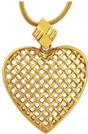
Zawieszka - Apart 229 zł