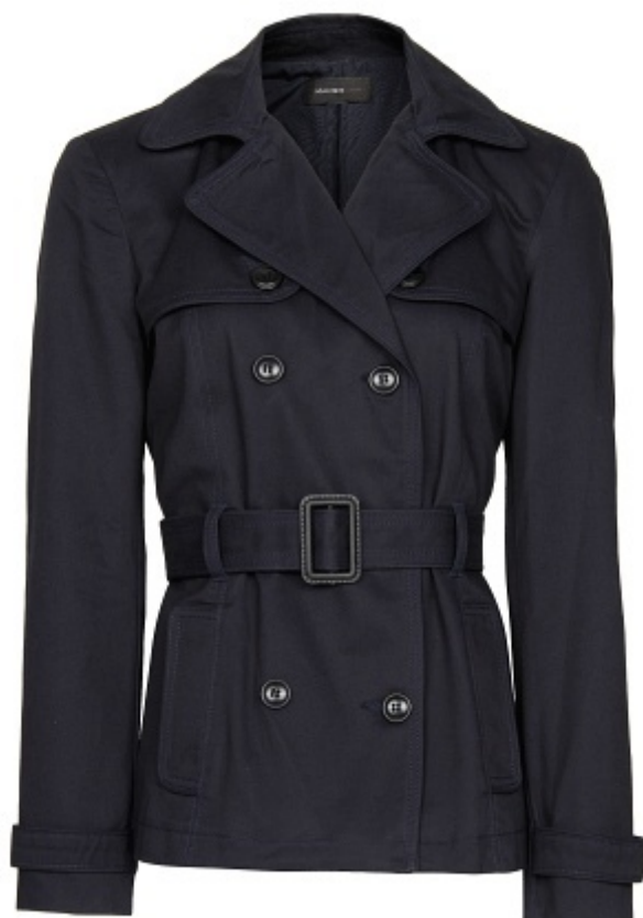
Płaszcz - Mango 129 zł