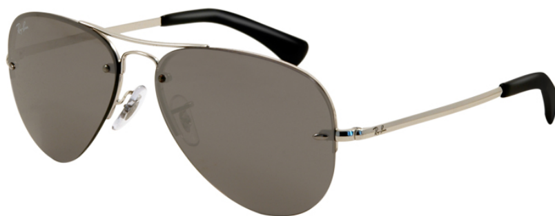
Okulary - Ray Ban