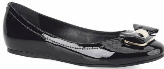
Baleriny - Kazar 349 zł