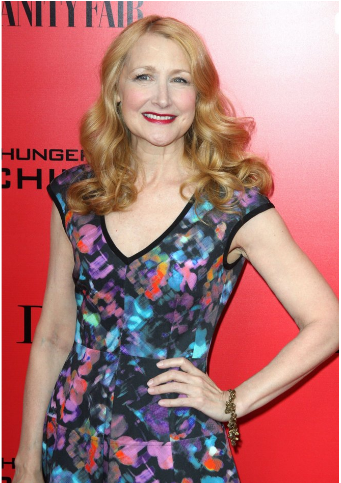
Czerwień kontra nude