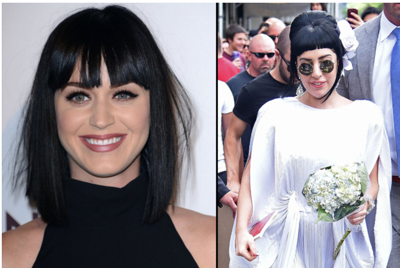
Katy Perry i Lady Gaga "ozdobiły" swoje ciała!

Zgadnijcie w jakim miejscu kolczyki wykonały znane gwiazdy? Oceńcie sami, jak się prezentują z nowymi elementami w swoim ciele.